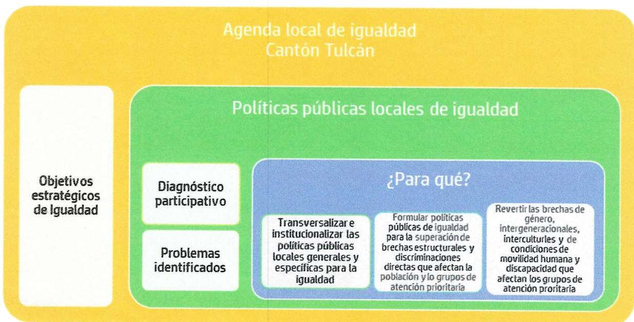
Ilustración 1. Componentes de la ALIT

Tal como se puede observar en la ilustración, la ALIT parte de objetivos estratégicos de igualdad que consideran a todos y cada uno de los enfoques y sujetos de derechos. A partir